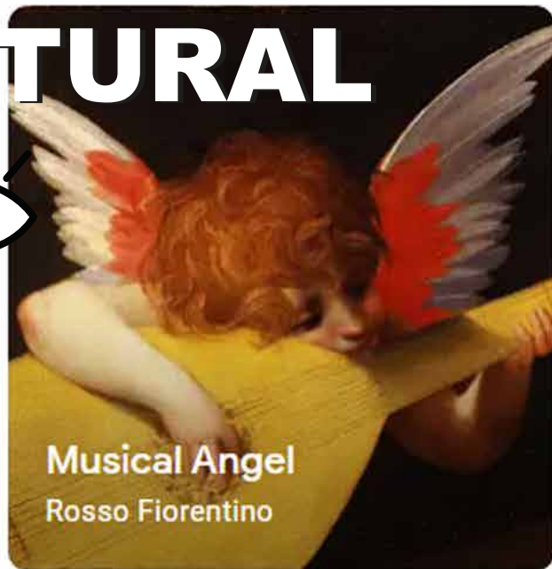
Musical Angel Rosso Fiorentino