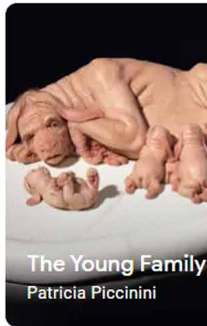
The Young Family Patricia Piccinini