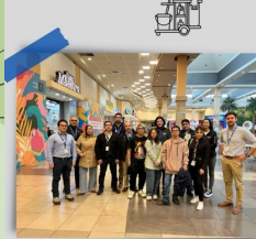
Inducción Alto Las Condes