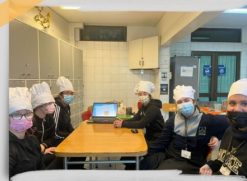
Taller de nociones básicas de manipulación de alimentos