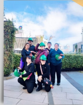
Etapa de reforzamiento certificación hotelaría